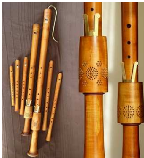
Consort complet de flûtes Renaissance, copie des instruments du Musée de Vienne, par Bruno Reinhard, facteur de flûtes à bec à Caromb (84).

Extrait de la Tragédie lyrique Les Boreades : Entrée d'Abaris, Contredanse en rondeau